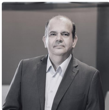
ALFREDO PALACIOS PRESIDENTE